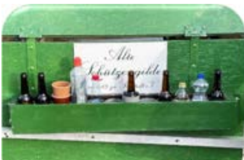
Getränke und Verpflegung sind an Bord

Teilnehmer tragen sich bitte in die im Schützenhaus ausgehängte Liste ein.