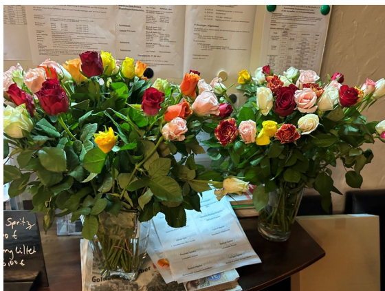
Zum 30. Jubiläum gab es für jede Dame eine Rose.